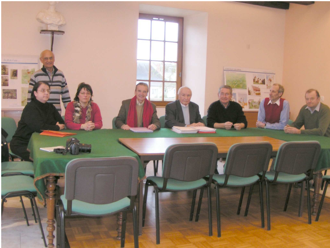
Première assemblée générale de l'association des « Amis de l'église Saint Martin et de la vie culturelle et historique du pays de Coussay Les Bois »

Président de l'Association des Amis de l'église Saint Martin et de la vie culturelle et historique du pays de Coussay-Les-Bois.